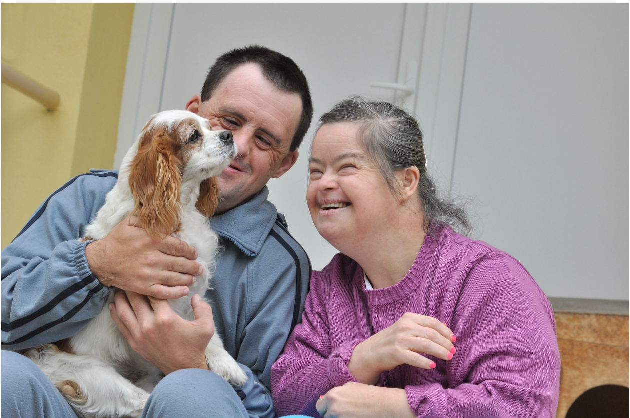
Oudere mensen met een verstandelijke beperking.