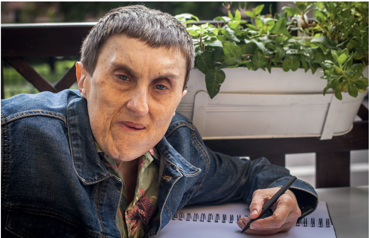
Oudere vrouw met verstandelijke beperking.

De ouder wordende mens met een verstandelijke beperking is een diverse groep met verschillende niveaus van verstandelijke beperking en verschillende achtergronden. Deze niveaus en achtergronden hebben verschillend effect op het ouder worden.