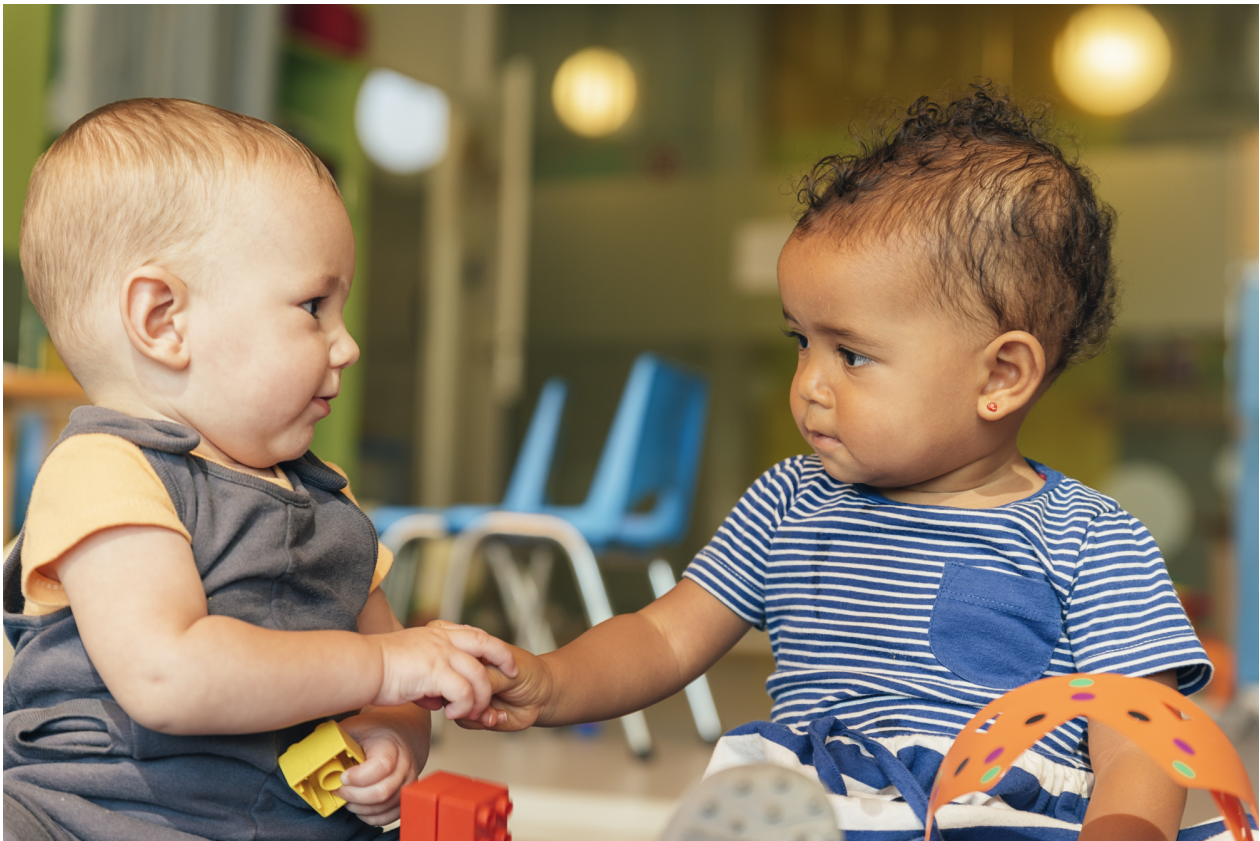
Je stimuleert de interactie tussen baby's.