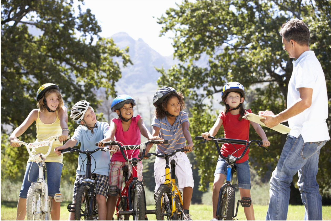
Een outdoor activiteit organiseren.

de benodigde middelen. Voordat deelnemers aan de slag mogen, ontvangen zij eerst de juiste instructies van de instructeur. Tijdens de activiteiten moeten de deelnemers goed begeleid en geïnstrueerd worden door de instructeur. Tot slot wordt elke activiteit geëvalueerd om na te gaan wat moet worden verbeterd.