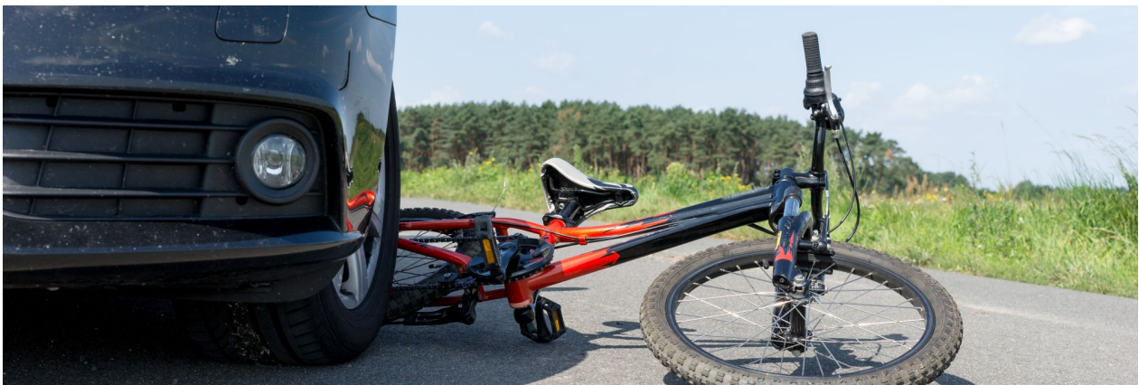
Een ongeval zit in een klein hoekje.

Vervolgens moeten per activiteit de risico's in kaart worden gebracht. Hierbij onderscheiden we verschillende factoren die risico's met zich mee kunnen brengen: