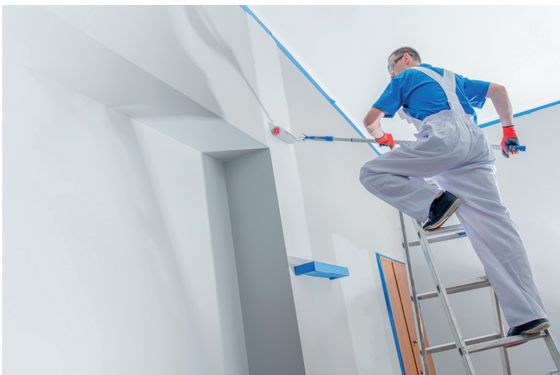
Schildert deze schilder wit of zwart?

Het risico ligt altijd op de loer dat de individuele belastingplichtige minder wil betalen dan hij volgens de wet zou moeten. En dan gaan sommigen over op belastingontduiking en belastingfraude. Het belastingstelsel is niet waterdicht. Altijd zoeken mensen naar de mazen in de wet. Het zo min mogelijk betalen van belasting lijkt wel een ‘nationale sport’. Er gaat veel ‘zwart geld’ in de economie om. Veel huiseigenaren betalen liever minder voor de klus. Ze vragen de schilder vaak of hij ook ‘zwart schildert’.