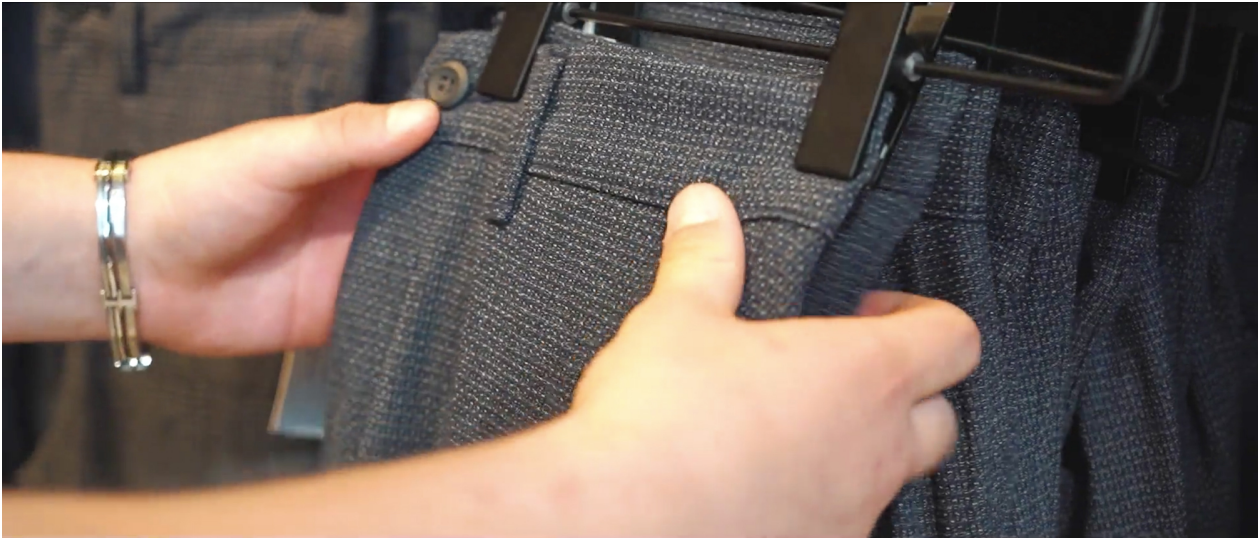
Broeken hangen netjes.