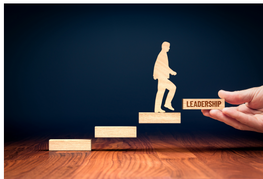
Persoonlijk leiderschap draagt bij aan persoonlijke ontwikkeling.

Persoonlijk leiderschap gaat om de invloed die je op situaties hebt en het effect daarvan. Wanneer je persoonlijk leiderschap ontwikkelt, kun je ook een effectievere leider voor anderen worden.