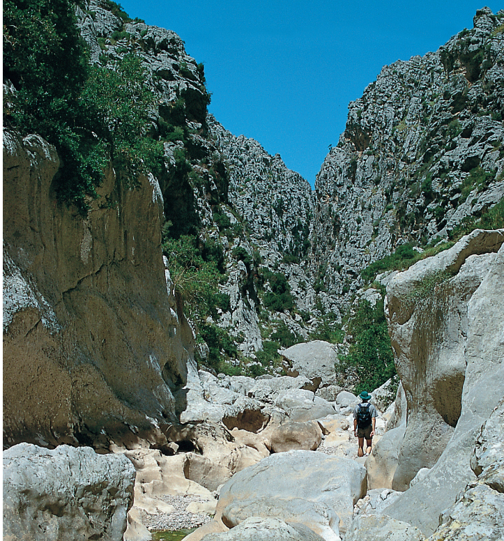
Door stortwater uitgehold kalkgesteente in de Torrent de Pareis.

een eerste rotsuitsprong heen. Op de steile wanden langs de erosiepoel, die in het begin van de zomer voor een deel nog met water gevuld zijn, kan de waterstand in de kloof worden afgelezen, die 's winters tot 2 m hoog kan zijn.