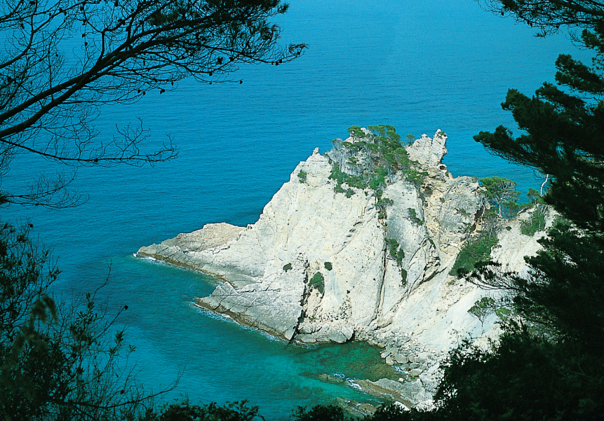
Schilderachtige kalkrotsen op de Punta de s'Aguila.

sage van de route. Machtige rotsbrokken liggen verloren langs het pad. Tussen de dennentoppen door vangt u zo nu en dan een glimp van de turquoise Cala Corp Mari op. Bijzonder pittoresk contrasteren daar de witte kalkrotsen op de Punta de s'Aguila mee, die associaties met Caspar David Friedrichs schilderij "Krijtrotsen op Rügen" opwekken.