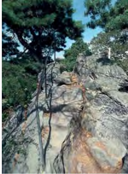
Door relingen gezekerd gedeelte van het kam-paadje op de Teufelsmauer (wandeling 45).

Maar in feite is het in de Harz het hele jaar door wandelseizoen: in het winterse bos op ski's over de besneeuwde kammen glijden is puur genot. Vanwege de grote klimaatverschillen tussen de gure Hochharz en de milde periferie is het echter niet mogelijk mei algemeen als de maand aan te wijzen waarin het wandelseizoen begint: nog op Walpurgis, dus begin mei, liggen er resten sneeuw in de bergen, terwijl aan de voet van de Teufelsmauer zeeën van kersenbloesems deinen en waaghalzen al aan de Blaue See liggen te zonnen. Vooral in het voorjaar is het daarom absoluut noodzakelijk dat u zich over de ski- en wandelcondities informeert: wie zonder ski's aankomt als er sneeuw ligt, zal in de bergen veel onbegaanbare wandelpaden aantreffen.