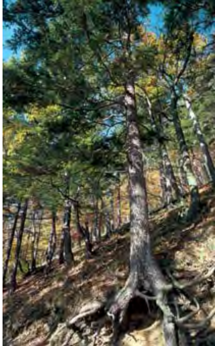
De naam Harz betekent 'met bos begroeid bergland': op de foto de Harzburger Burgberg.

Het reliëf met de hooggelegen Oberharz in het westen en de laaggelegen Unterharz in het oosten bepaalt de neerslagverdeling. De overwegend uit het westen en zuidwesten aangevoerde luchtmassa's van Atlantische herkomst worden door de Harz tot opstijgen gedwongen, koelen af en moeten hun vochtigheid kwijt. Het Acker-Bruchberg- en het Brockenmassief krijgen daardoor de meeste neerslag. Het zeer geneeskrachtige klimaat heeft de Harz zich sinds de 19e eeuw tot een veelbezocht recreatiegebied laten ontwikkelen. Tal van plaatsen tooien zich met de kwalificatie 'luchtkuuroord', andere laten hun plaatsnaam voorafgaan door 'Bad', om aan te geven dat het hier om officieel erkende kuuroorden met natuurlijke geneeskrachtige bronnen gaat.