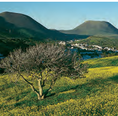
Het ontwaken van de lente aan de voet van Monte Corona.