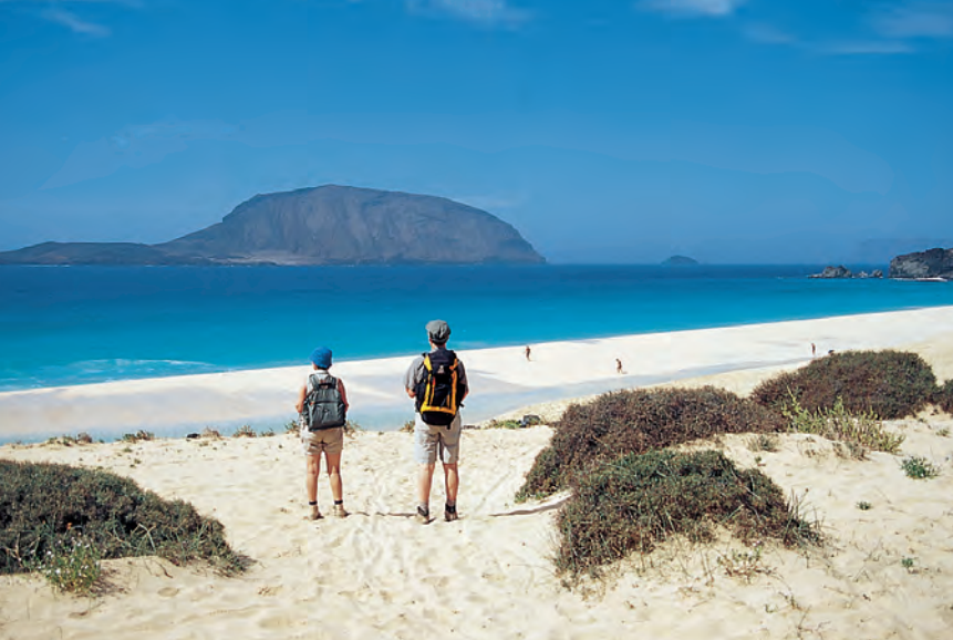
Het superstrand Playa de las Conchas voor de achtergrond van het rotseiland Montaña Clara.

men of toch liever die korte tijd tot de afvaart van de veerboot op het strand doorbrengen en gelijk naar beneden naar Playa de las Conchas. Van de uitloper van de bergkam loopt een duidelijk paadje naar het kruis op de top van Montaña Bermeja (152 m). De korte beklimming wordt met een fantastisch uitzicht over de Chinijo-archipel beloond.