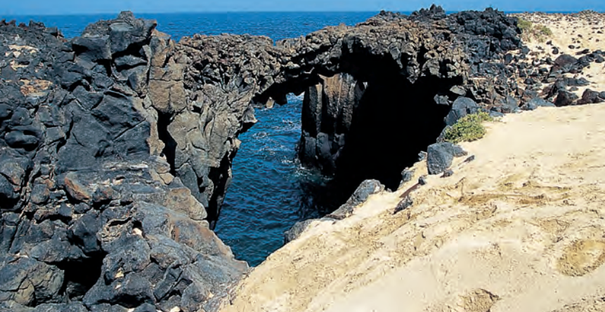
Bij Playa Lambra overspannen zwarte basaltbruggen het water.