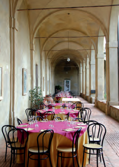
Kruisgang in de Certosa di Pontignano (wandeling 2).