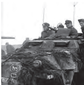
116e pantserdivisie Windhund

Het resterende regiment van de 106 e divisie, het 424 e , werd op 17 december uit Winterspelt verdreven, trok zich terug over de Our en maakte daar contact met de te hulp geschoten tanks van de 9 e pantserdivisie. Op de westoever van de Our werd een nieuwe verdedigingslinie gevormd om de route naar St. Vith te blokkeren. De verdedigers kregen ook versterking van de voorhoede van de 7 e pantserdivisie. Het moedige verzet van de soldaten van de 106 e divisie had tot gevolg dat de troepen van Von Manteuffel langer werden opgehouden dan verwacht. Ook de tankreserves, de Führer Begleit ,