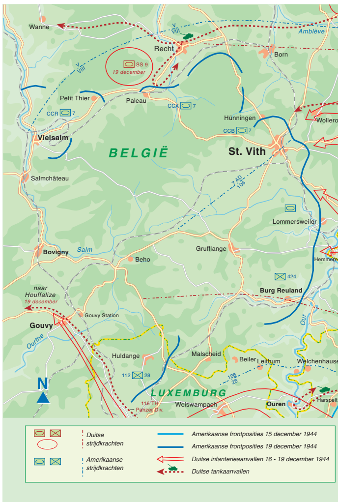
Aanval 5e pantserleger 16-19 december 1944