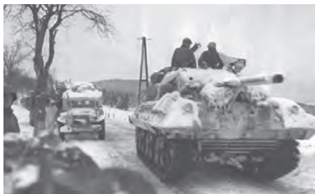
Sherman tank van 7e pantserdivisie baant zich een weg naar St. Vith