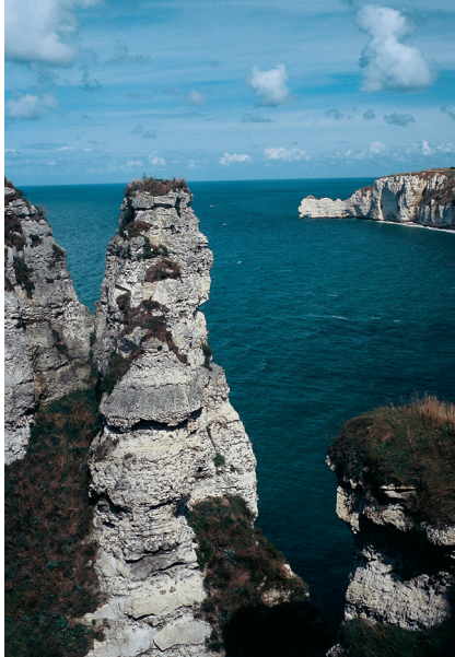
Alleen zee en rotsen: de Falaises d'Aval.

Aan de andere kant van het dal klimt u – deels via trappen en de gele markering volgend – steil naar het kalksteenplateau, waar u uitkomt op de GR21. De wit/rood gemarkeerde wandelroute loopt verder langs de schitterende steile kust en passeert de rotspunt van de Pointe de la Courtine. Dan moet er nog een klein dal worden overgestoken (pittig afdalen en klimmen) en aansluitend de kaap van La Manneporte worden afgestoken door het binnenland. U nadert nu de grandioze rotsboog van de Porte d'Aval (9) , die doet denken aan een olifantenkop met slurf. Daarachter rijst de 40 m hoge rotsnaald Aiguille op uit zee. Hier moet u beslist naar links een omweg maken naar het uitkijkpunt om te kunnen genieten van het unieke uitzicht op de steile kliffen, de rotsboog van La Manneporte en de badplaats Étretat. Daarna voert de GR u – af en toe via trappen – steil heuvelafwaarts naar het kiezelstrand en het parkeerterrein in Étretat (1) .