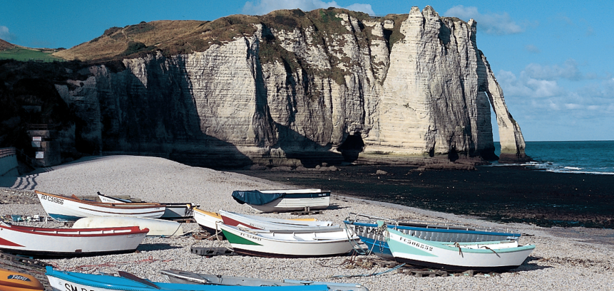
Een geliefd onderwerp van Monet: de Falaises d'Aval van Étretat.

huizen van Le Tilleul (4) steekt u de asfaltweg over om kort daarna nog een asfaltweg te bereiken. Hier volgt u de geasfalteerde Rue de la Justice verder naar de volgende kruising.