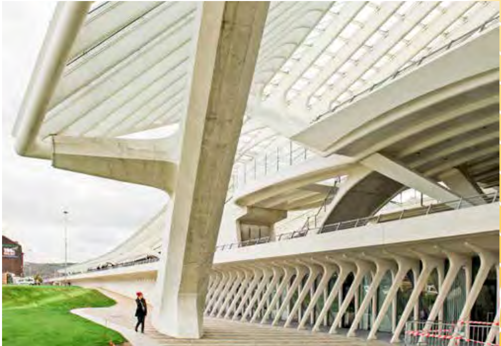
Luik, station Liège-Guillemins

'Mooi' vind ik wel het juiste woord voor het begin- of eindpunt van deze route: station Liège-Guillemins. Iedereen ziet iets anders in dit futuristische gebouw uit 2009 van de Spaanse architect Santiago Calatrava. De een moet denken aan een ruimteschip, een ander aan de vleugels van een engel, een golvende zee of zelfs een nomadentent in de woestijn. Ik houd het zelf op een UFO.