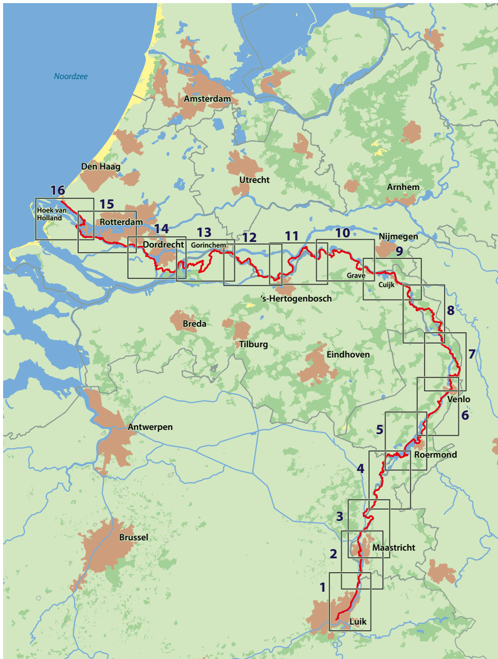
Overzichtskaart van de route