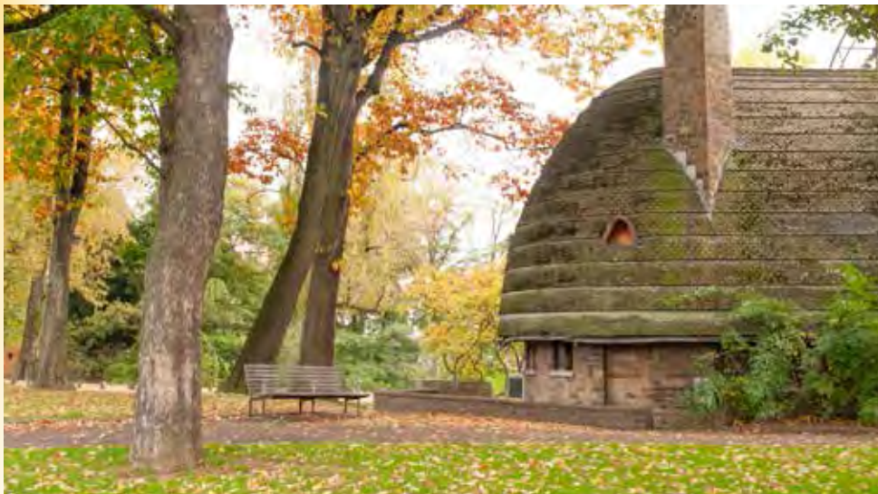
Parc de la Boverie

Aan de noordoostkant van Luik is het zuidelijke beginpunt van het Albertkanaal (c) . Dit punt kan je niet ontgaan, want op de kop van het eiland dat ontstond door het graven van het kanaal staat een reusachtig beeld van koning Albert I. Op 31 mei 1930, op de 100e verjaardag van België stak hij de eerste spa in de grond voor de aanleg van het kanaal. Het 130 kilometer lange kanaal verbindt Luik met Antwerpen. Het werd aangelegd, omdat de oude verbinding via smalle kanalen, met een grote omweg en met veel handbediende sluisen steeds meer tekortschoot. De boottocht duurde minimaal een week. Verder werd in Nederland het Julianakanaal aangelegd en ontstond de angst dat schippers een route naar zee zouden gaan kiezen via Rotterdam. Het