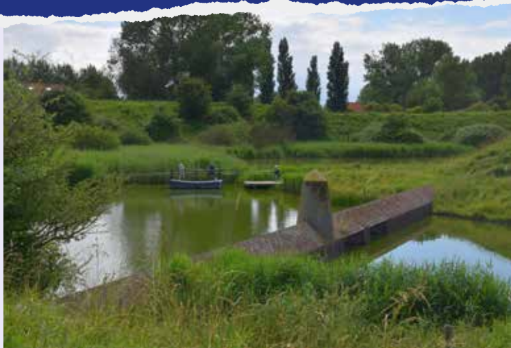
Trekpuntje in de Veerse Vesten