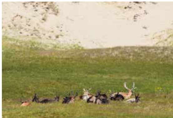
Damherten in de Zeepeduin

De Duinpolders waren in de achttiende eeuw nog prominent aanwezig. Let ook op de benaming 'Polder Goed'. Kaart Hattinga 1752, Zeeuws Archief