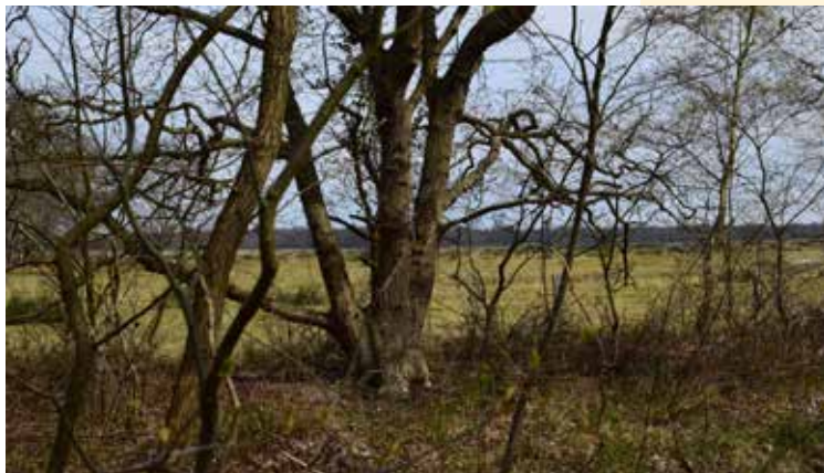
De vroongronden zijn niet toegankelijk