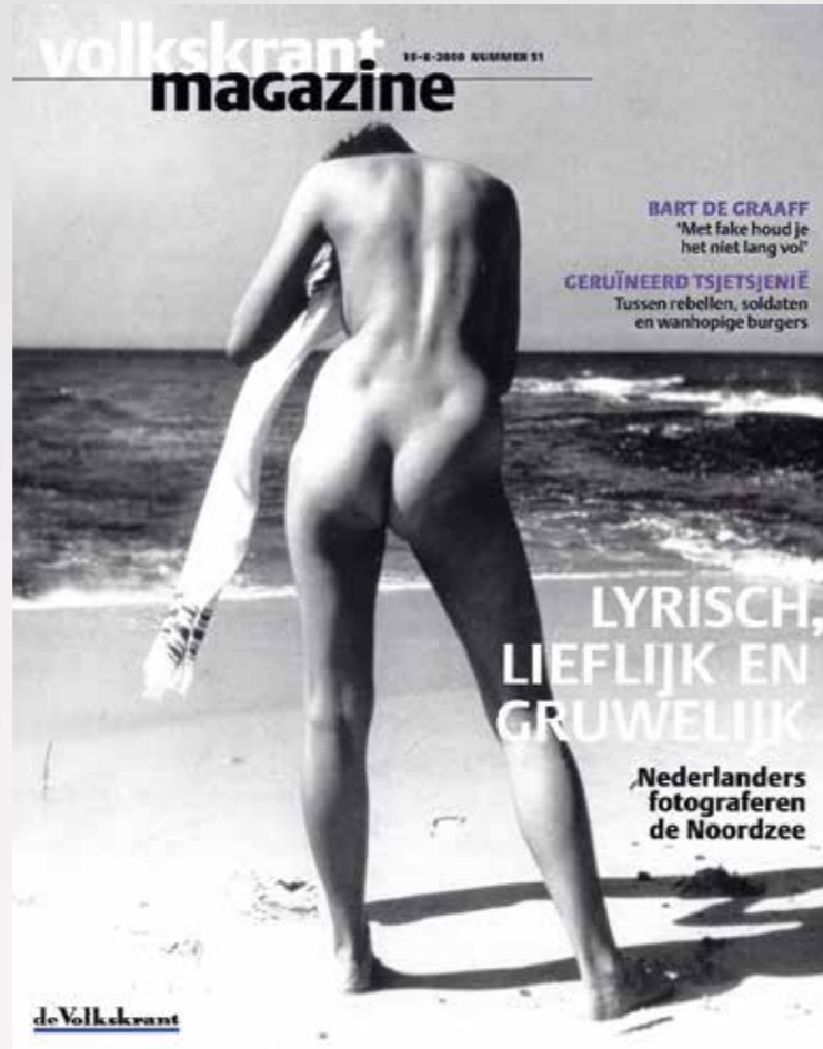
VAN LINKS AF: ABC, CAPITAL PHOTOS, MARCEL VAN DEN BERGH, EMMY ANDRIESEN