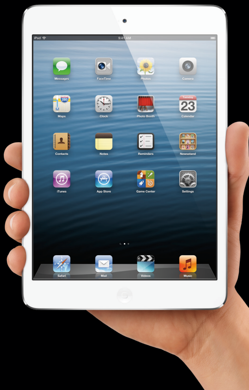
De nieuwe iPad mini

In september 2012 kwam er een nieuwe versie van het besturingssysteem uit, onder de naam iOS 6. Deze versie introduceerde een aantal, voor de iPad, nieuwe functies, zoals Siri (jouw persoonlijke assistent), Facebook integratie en verbeterde iCloud ondersteuning. Dit zijn allemaal handigheden waar de gemiddelde iPad-gebruiker met smart op zat te wachten.