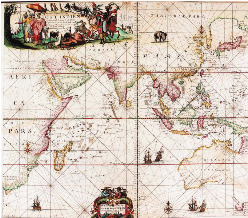
Figuur 1.3 Het openen van de wereld

Bekeken vanuit een Europees perspectief – ethnocentrisch dus – hebben ‘wij’ de wereld ontdekt en in kaart gebracht. Die confrontatie met de wereld zou de Europese samenlevingen grondig veranderen en uitmonden in de hedendaagse globalisering. De kaart toont ‘Oost-Indiën’ in 1689: van Kaap Goede Hoop over voor-India naar Oost-Azië. Zij werd gebruikt door de Verenigde Oost-Indische Compagnie. De VOC werd opgericht in 1602, was vooral bedrijvig in de handel in kruiden en specerijen en groeide snel uit tot een van de grootste multinationale bedrijven van de zeventiende en de achttiende eeuw.