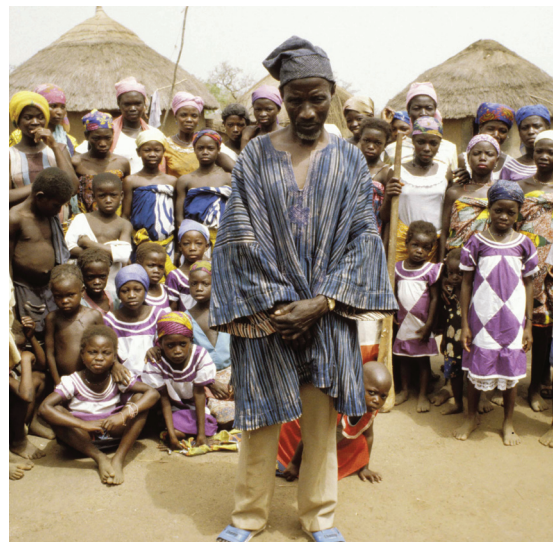
Figuur 1.2 Monogamie en polygamie in beeld

De ene foto toont een klein nucleair gezin, vader, moeder en twee kinderen, zoals er in België en Nederland vele zijn. De andere toont de vader van een polygaam gezin uit Ghana. De man staat voor zijn elf vrouwen en een aantal van zijn talrijke kinderen.