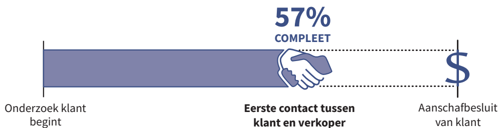
FIGUUR 1.1

Of dit percentage juist is, is moeilijk te zeggen. Andere onderzoeken stellen een hoger percentage vast, weer andere een lager. Wat van belang is, is dat sales zich moet aanpassen aan een klant die al ver voor het eerste contact gestart is met zijn aankoopproces. Afgezien van het feit dat sales moet samenwerken met de marketing- en communicatieafdeling om die product- en diensteninformatie online te verspreiden die noodzakelijk en uitnodigend zijn voor leads en klanten (indirecte invloed op het eerste deel van het proces), moet zij zich vooral ook richten op het tweede deel van het proces, het deel waar zij direct bij betrokken is.