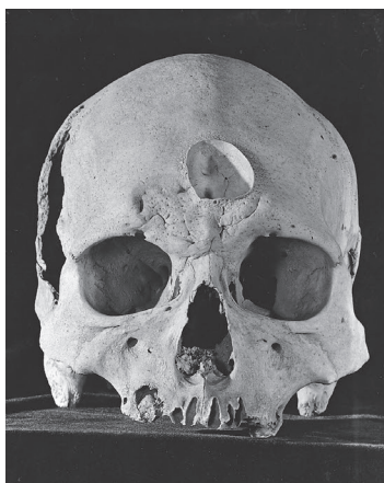
Trepanatie. Trepanatie is een procedure waarbij men een gat in de schedel maakt. Sommige onderzoekers vermoeden dat het gebruik een antieke vorm van chirurgie is. Misschien was trepanatie bedoeld om het slachtoffer te bevrijden van de demonen die men verantwoordelijk achtte voor zijn of haar abnormale gedrag.

Zelfs de woorden waarmee we psychische stoornissen beschrijven – woorden als depressie of geestelijke gezondheid – kunnen in andere culturen een andere betekenis hebben. In sommige talen bestaat er zelfs helemaal geen