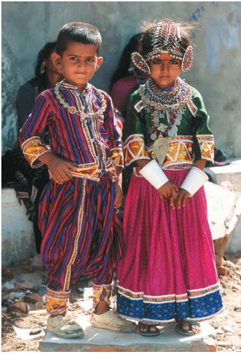
Deze bruiloft van twee kinderen in India is een voorbeeld van het belang van omgevingsfactoren voor de leeftijd waarop een bepaalde gebeurtenis zich voltrekt.