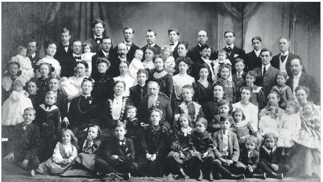
Polygamie in beeld: Joseph F. Smith