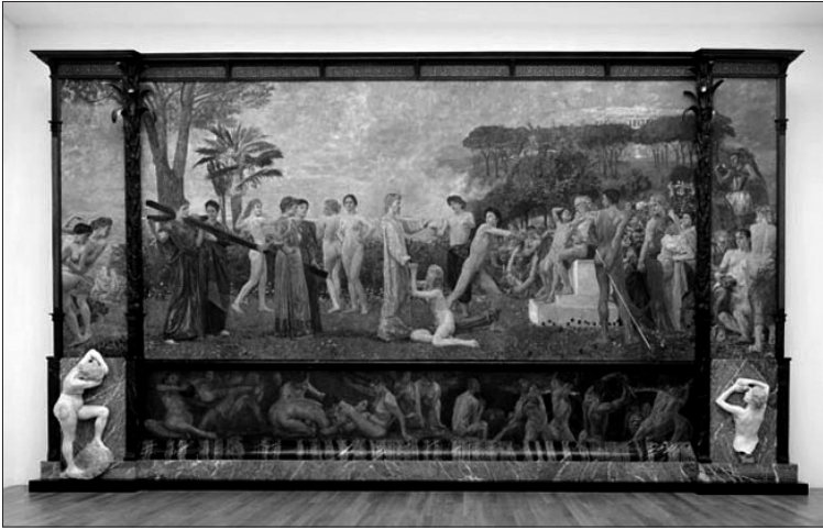
Max Klinger, Christus im Olymp