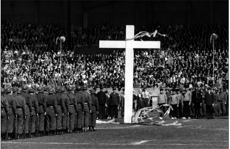
Opening van de herdenking van 1940-1945 in het stadion te Amsterdam, 31 augustus 1945.