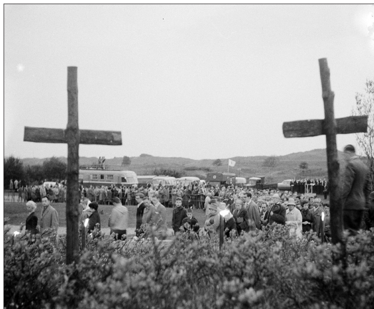
Dodenherdenking op de Waalsdorpervlakte, 4 mei 1961.