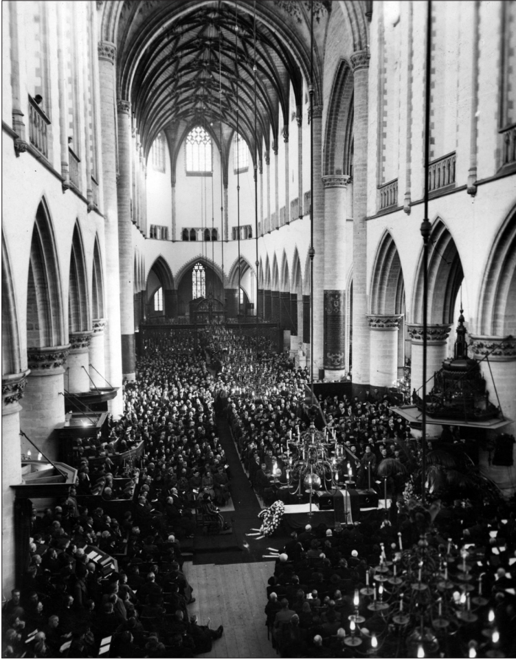
Rouwdienst in de Grote Kerk te Haarlem op 27 november 1945 ter ere van 400 illegale strijders die door de Duitsers werden gefusilleerd en wier lichamen gevonden zijn. Koningin Wilhelmina, minister-president Schermerhorn en prins Bernhard woonden de rouwdienst bij.