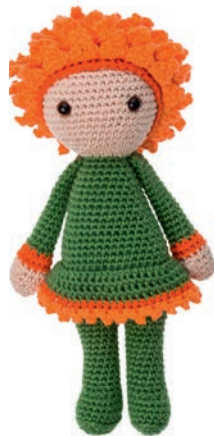
DAHLIA DIANA 50