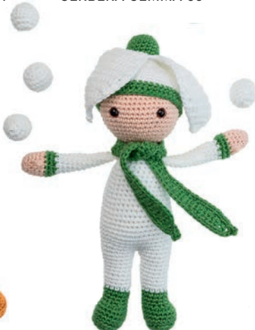
SNEUWKLOKJE SIA 90