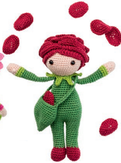
ROOS ROXY 74