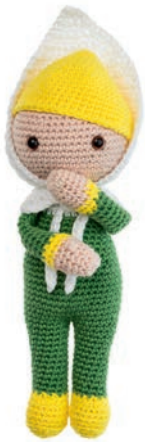
CALLA LELIE CRISTA 64