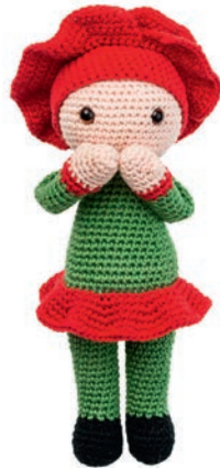
KLAPROOS PAOLA 29