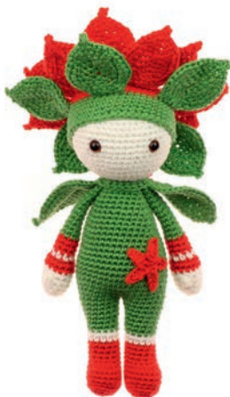
KERSTSTER KRIS 106