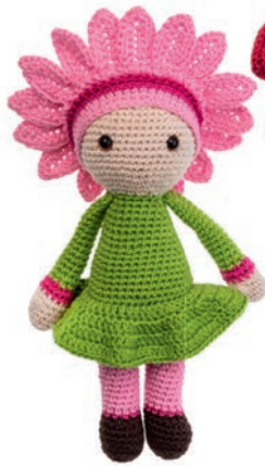
GERBERA GEMMA 69