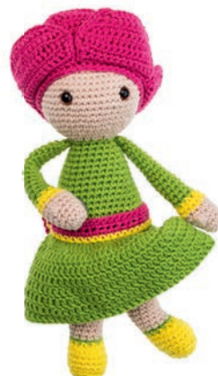
PIOENROOS PAM 96