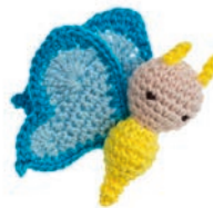
VLINDER VICKY 54