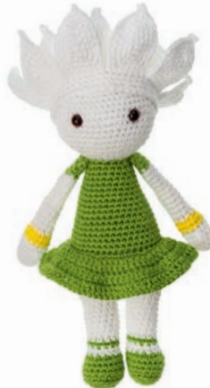
WATERLELIE WINNIE 34