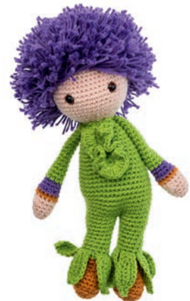
SIERUI OTTO 58