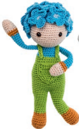
HORTENSIA HENK 83