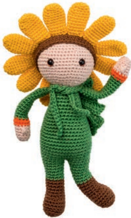
ZONNEBLOEM SAM 24