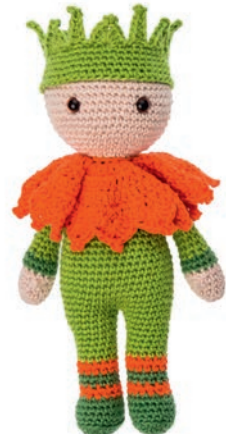
KEIZERSKROON KEES 103