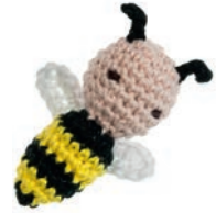
BIJ BELLE 80