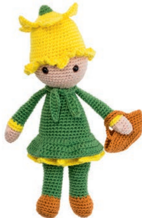
NARCIS NANCY 45