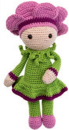
ANEMOON ANNIE 39