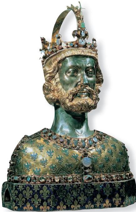
Deze buste van keizer Karel de Grote uit de schatkamer van de Dom in Aken straalt zijn macht en status uit.

De Romeinen trokken zich terug en hun rijk ging ten onder, maar zijn erfenis drukte een stempel op de Duitse geschiedenis. Het christendom werd de leidende godsdienst en het stedelijk leven bloeide. Ook nu nog hebben de ooit bezette gebieden langs de Rijn een heel speciale, bijna Bourgondische sfeer die andere delen van Duitsland vreemd is.