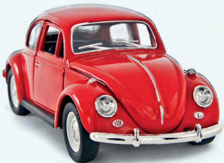
De klassieke Volkswagen Kever.

Liefhebbers van geschiedenis, steden en architectuur kunnen het best beginnen in Berlijn . De Duitse hoofdstad betovert bezoekers met zijn fantastische musea, een bruisend nachtleven en gebouwen die variëren van imposant statig tot gewaagd (twee dagen). De volgende stop, Dresden , ligt 190 km zuidelijker en is de barokke parel aan de Elbe (twee dagen). Hierna kunt u één dag doorbrengen in het klassieke Leipzig , dat 110 km naar het noordwesten ligt en waar Bach en Mendelssohn ooit als dirigent optraden. Voor het Oktoberfest in München neemt u de hogesnelheidstrein ICE, die u circa 420 km naar het zuiden brengt voor een evenement dat in het teken staat van bier en bratwurst (twee dagen). De hoofdstad van Beieren is een goede uitvalsbasis voor een bezoek aan het Dachau herinneringscentrum bij Dachau of de Alpen als u wilt skiën.