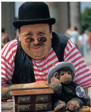
Een orgelman in Berlijn.

Sinds 1990 is Berlijn weer de hoofdstad van het herenigde Duitsland en heeft het de goede betrekkingen met steden in de omgeving en op het platteland van de deelstaat Brandenburg hersteld. Toch hebben de inwoners van Brandenburg, die vreesden voor dominantie van de metropool, in 1996 met kracht een voorstel om Berlijn en Brandenburg samen te voegen van de hand gewezen.