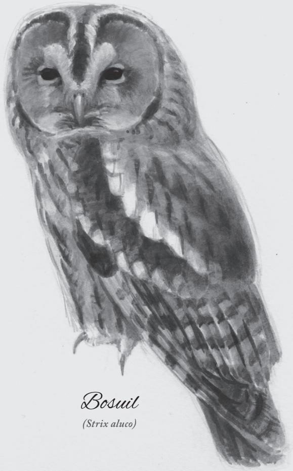
Bosuil ( Strix aluco )