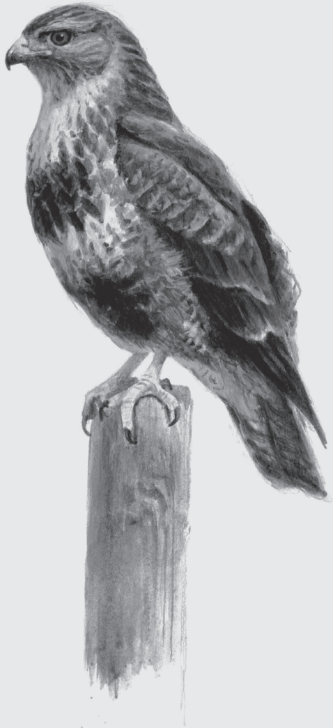
Buizerd ( Buteo buteo )