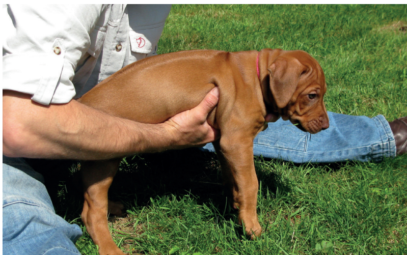
Tijdens deze 'zweefproef' wordt de mate van overgave getest.