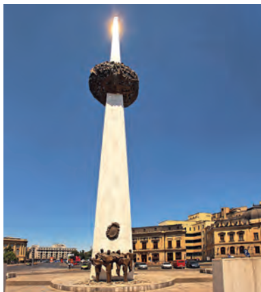
Memorialul Renasterii (Monument van de Opstand van 1989) op de Piața Revoluției in Boekarest wordt in de volksmond 'de aardappel' genoemd.

Ten westen en noordwesten van het Hof van Vlad vindt u de eens zo deftige promenade Calea Victoriei, het Cișmigiu-park, het schitterende gebouw van de medische faculteit, het Cotroceni-paleis, de botanische tuin (Grădina Botanică) en statige herenhuizen. Ten slotte komt u bij een kopie van de Parijse Arc de Triomphe, te midden van lommerrijke straten en prachtige huizen, en een aantal curieuze