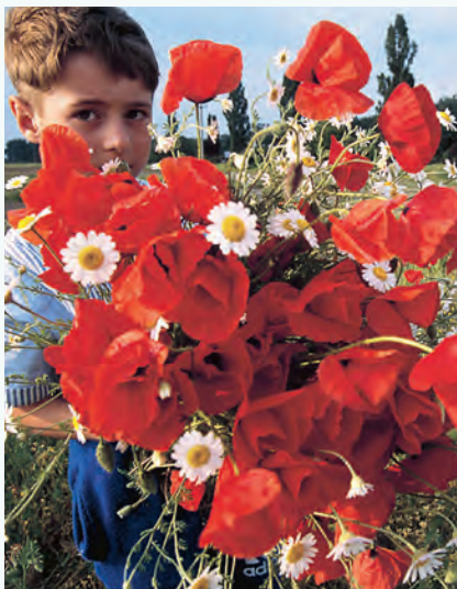
Een jongen in Vlahița, Transsylvanië, tijdens het jaarlijkse Narcissenfestival.

In Roemenië mag u binnen de bebouwde kom niet harder dan 50 km/u rijden en buiten de dorpen en steden 80 km/u. Op snelwegen mag u 100 km/u of 120 km/u al naargelang wat staat aangegeven. Het voeren van gewoon