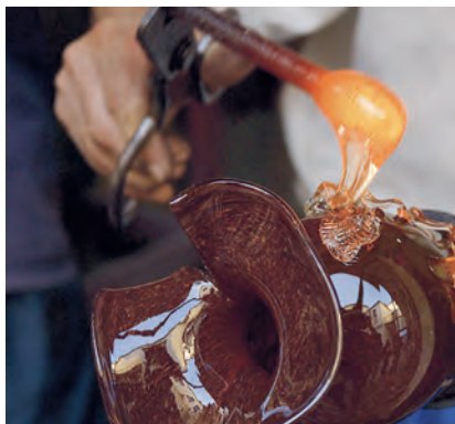
Een glasblazer in Curtea Sticlarilor, Lipscani.

de Strada Lipscani komt u op de binnenplaats Hanul cu Tei (Lindeboomherberg). In 1833 bouwden twee kooplieden, die aan weerszijden van de straat winkels hadden, hier een herberg. Nu vindt u er kunst- en antiekwinkeltjes. De nabijgelegen resten van de Hanul Gabroveni (Str. Lipscani