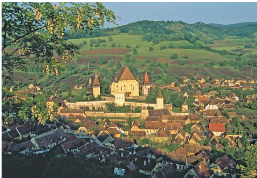
De plaats Biertan, gesticht in 1224, is een van de oudste Duitse nederzettingen in Transsylvanië.

stad. Veel gezinnen die nu in de stad wonen, hebben ergens nog een lapje grond waar ze in het weekend of in de vakanties te vinden zijn. De tegenstelling tussen de stad en het platteland blijkt vooral wanneer glimmende nieuwe auto's door kleine dorpjes scheuren en zich niets aantrekken van de eeuwig trage mensen of koeien.