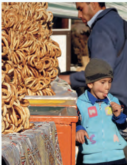
Heerlijke covrigi (pretzels) op de markt van Curteade Argeş.

Roemenië heeft een zeer uitgebreid spoorwegennetwerk, maar de treinen zijn helaas niet altijd even punctueel en comfortabel. Voor de langere afstanden tussen de grote steden, is de trein wel een uitstekende manier om de Roemenen te leren kennen, u zult ongetwijfeld contact krijgen met uw Roemeense medepasagiers. Ook enkele 'kleine' spoorlijnen die door de bergen rijden of door agrarisch gebied, zijn als u voldoende tijd hebt zeer aan te raden. Als u snel van Boekarest naar een van de grotere steden wilt reizen, kunt u het best een binnenlandse vlucht nemen met Tarom, de nationale luchtvaartmaatschappij.