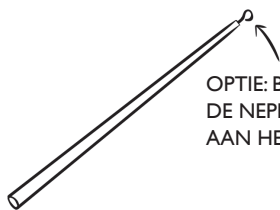
HOUTEN STOKJE MET OOGJE

OPTIE: BEVESTIG DE NEPPROOI DIRECT AAN HET STOKJE