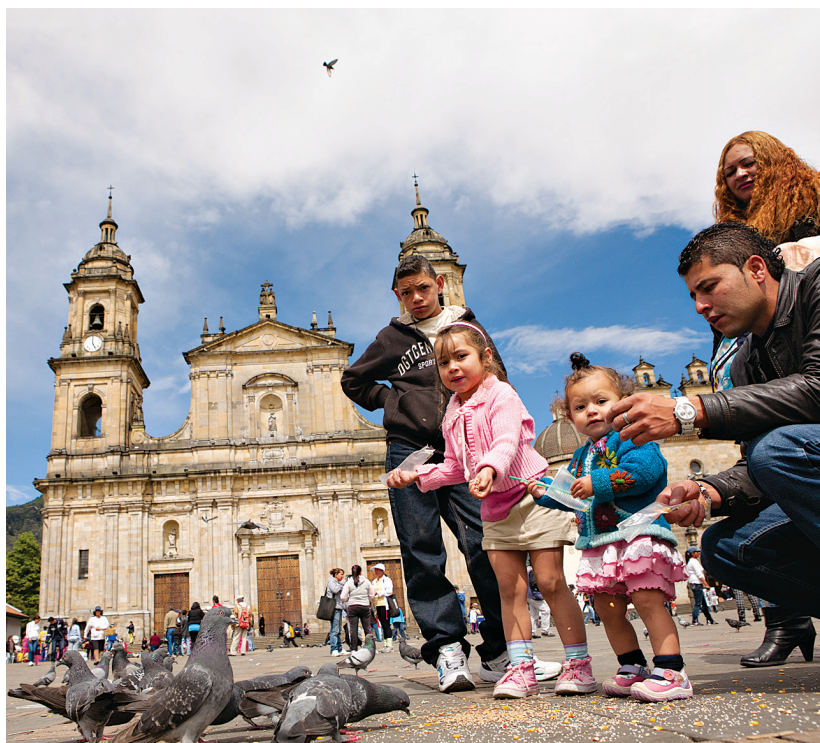
Vogels voeren op Plaza de Bolívar in La Candelaria, hét sociale centrum van Bogotá.

Het oude hart van de stad helt oostwaarts omhoog in de richting van de Cerro Monserrate. Het centrum bestaat uit verschillende kerkdistricten, zoals La Catedral, La Concordia en La Merced, oude koloniale kerken. De wijk La Candelaria werd in 1963 tot een nationaal monument verklaard. De bouwstijl van de wijk is gemengd: er staan eenvoudige koloniale huizen en vorstelijke neoclassicistische gebouwen, maar ook schitterende art-deco- en modernistische gebouwen uit de jaren vijftig.