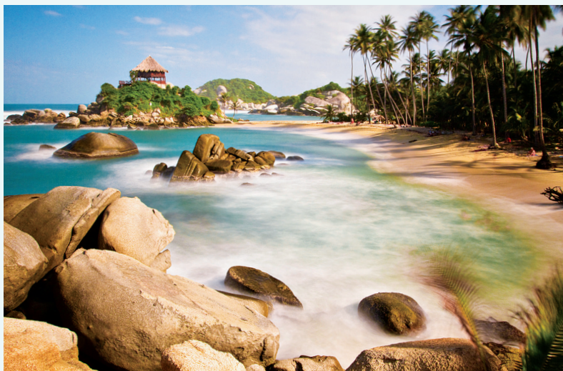
Parque Nacional Natural Tayrona heeft een paar van de mooiste stranden van Colombia.