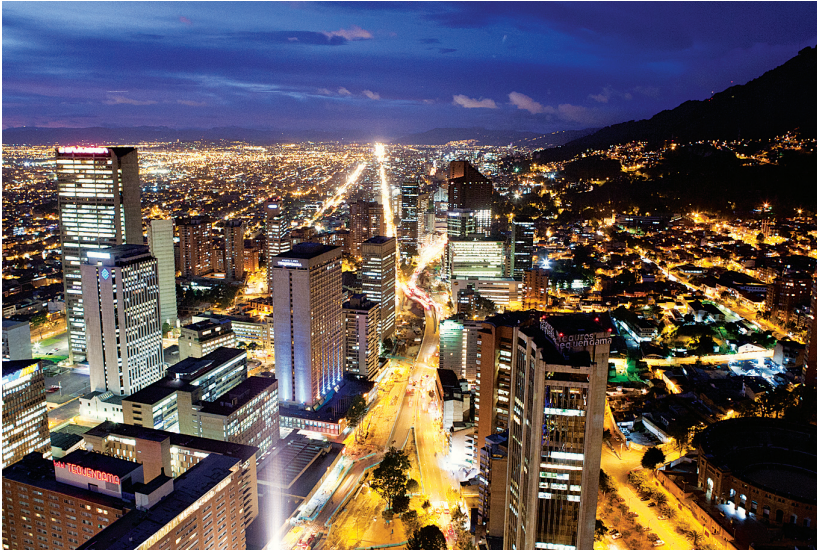
Wolkenkrabbers bij het vallen van de avond in het Centro Internacional van Bogotá.

De Colombiaanse hoofdstad heeft een Europees karakter maar een Latijns-Amerikaanse ziel. Met 11,6 miljoen inwoners is Bogotá een kosmopolitische metropool, die zich gedurende de laatste twee decennia heeft ontwikkeld tot een hartverwarmende reisbestemming. Dankzij het nabijgelegen vliegveld is Bogotá ook de perfecte uitvalsbasis voor andere bezienswaardigheden in het hele land.