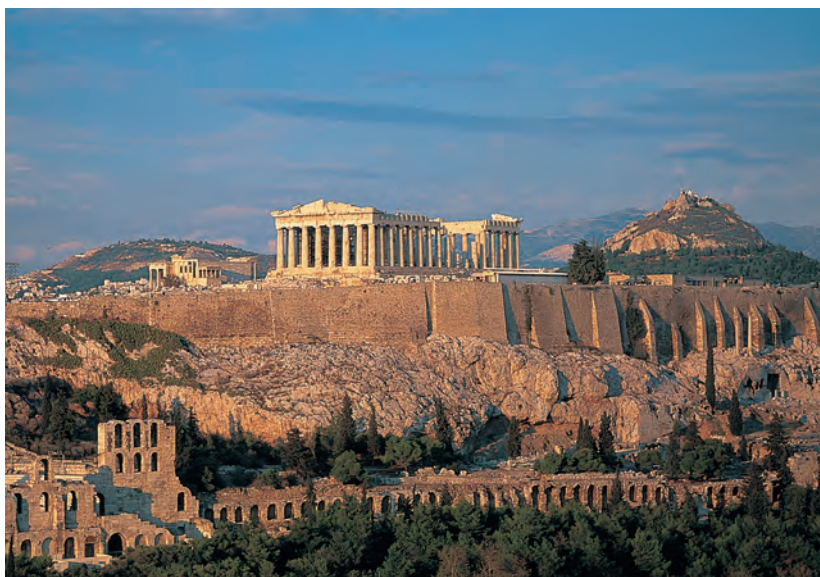
Het Parthenon en de Akropolis doemen hoog op boven het hedendaagse Athene.

Akro poli betekent 'bovenstad'. Veel Griekse steden hebben een akropolis, maar die van Athene is het beroemdst vanwege het Parthenon. Of u het nu overdag ziet bij aankomst, 's avonds vanaf uw hotelbalkon of van dichtbij wanneer u het bezoekt, het Parthenon steekt overal dominant boven Athene uit en herinnert constant aan de Gouden Eeuw van het oude Griekenland.