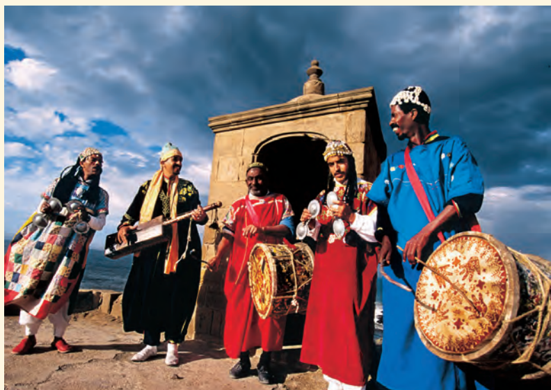
Gnaoua-muzikanten spelen boven op het bolwerk van Essaouira tijdens het zomermuziekfestival.

De Marokkaanse kalender telt zowel traditionele oogstfeesten als religieuze feestdagen die moussems worden genoemd. Ook kunnen bezoekers concerten en vertoon van ruiterkunst bijwonen, zogeheten fantasias . Stuk voor stuk bieden ze geweldige kansen om kennis te maken met plaatselijke gemeenschappen.