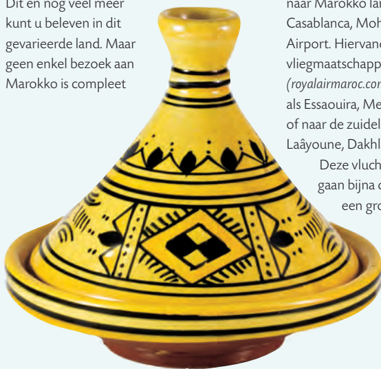
Een traditioneel beschilderde tajine.

Of u nu afdingt op een stuk aardewerk met een glas muntthee erbij, genietend van de humor van de winkeleigenaar, of een trektocht maakt dwars door de woestijn op een kameel met gelijkgestemde avonturiers, u vindt ongetwijfeld een spannende activiteit die bij u past in Marokko. Misschien wilt u de hoogste berg van het land bedwingen, de Jebel Toubkal, surfen op de golven van de Atlantische Oceaan, een wandeling maken door een rivierdal, of zeldzame vogels spotten? Of zoekt u een meer ontspannen manier om uw tijd door te brengen, zoals van de zon genieten op het terras van een chic café in Tanger met uitzicht op de Middellandse Zee? Dit en nog veel meer kunt u beleven in dit gevarieerde land. Maar geen enkel bezoek aan Marokko is compleet