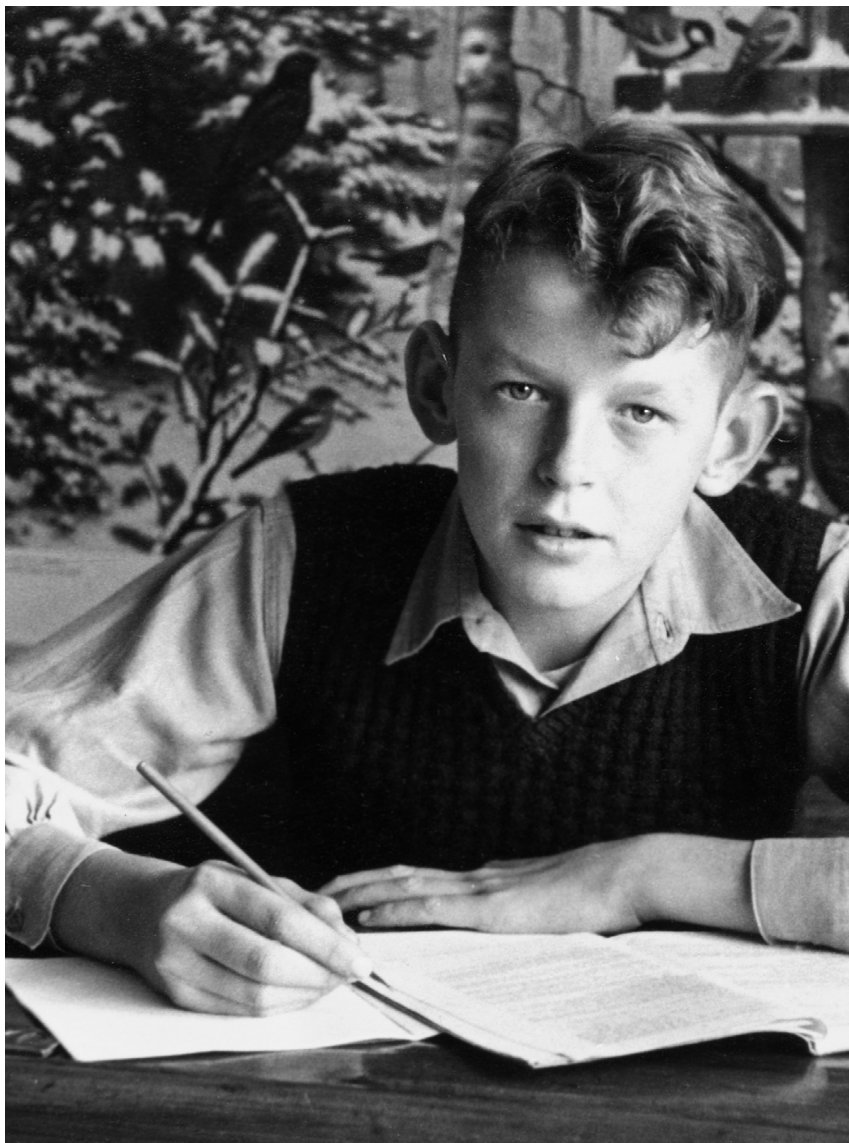
LEERLING VAN DE OPENBARE LAGERE SCHOOL IN BERGAMBACHT.