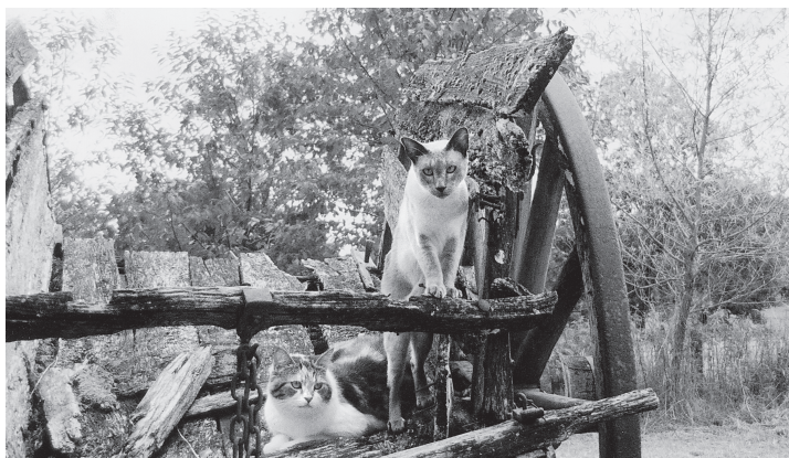
Pico en Bello

kon ik net zo goed thuisblijven. Een mooi landschap telt voor mij niet als de zon er niet op schijnt, dus het moest onder het regengebied van de Loire liggen. Het moest er niet te toeristisch zijn, pseudoniem voor: er moeten niet al te veel Nederlanders zitten. Het moest een mooi uitzicht hebben en de burens moesten niet al te hinderlijk aanwezig zijn.