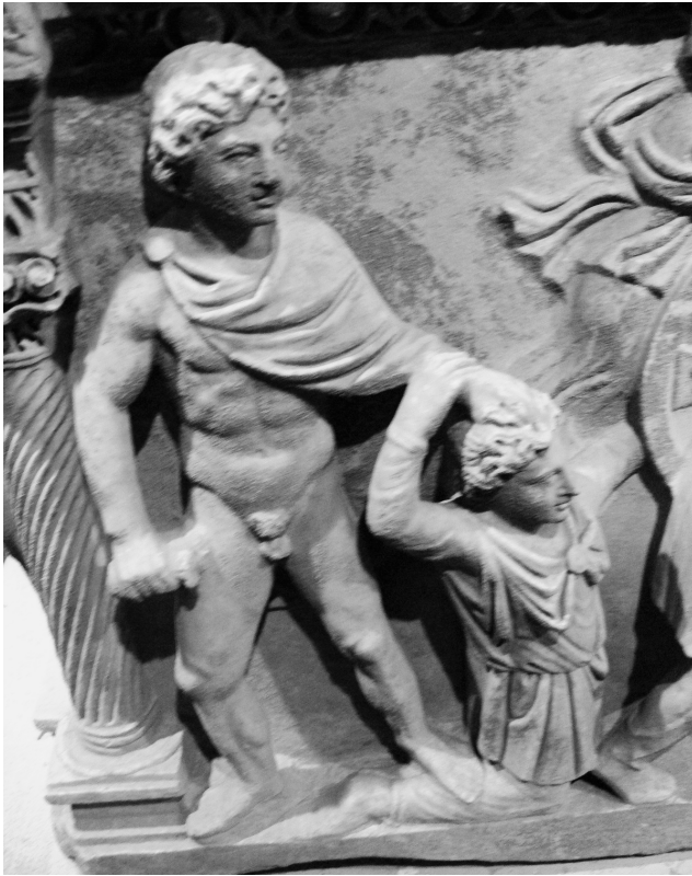
Odysseus slaat Thersites (afgebeeld op een Romeinse sarcofaag in het Museum van Antalya)

Dat ongetwijfeld ten uitvoer gebracht wordt. Indien ik U ooit weer Zó als ge nu aan het kijken waart, als een verdwaasde vind razen, Dan mag Odysseus het hoofd van zijn schouders verliezen; niet langer Heten Telemachus' vader, wanneer ik U niet uwe kleren Ruk van het lijf, uw mantel en chiton, bedekkend uw schaamte, En U niet jammerend weg naar de snelle galeien zal jagen, Uit de vergaading naar buiten geranseld met smaadlijke slagen. 2