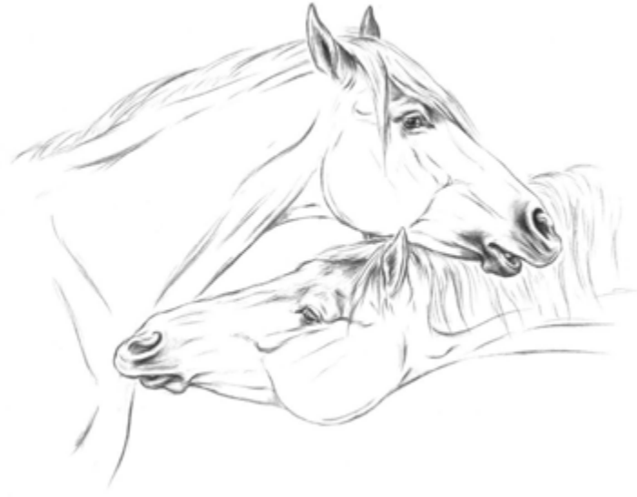
Emoties in expressiegedrag Boven: pijngezicht. Rechts: genietend gezicht

van hun in het wild levende soortgenoten. Voor het bepalen van het normale gedrag moet de context waarin het gedragspatroon optreedt, worden bepaald. De kennis van wat het normale gedrag van het paard in een bepaalde context is, is een voorwaarde om gedragsstoornissen en ongewenst gedrag te kunnen herkennen en definiëren. Door de recente ontcijfering van het paardengenoom met ongeveer 2,7 miljard basisparen zal het in de toekomst mogelijk zijn behalve erfelijke ziekten en prestatievermogen ook de gedragspatronen van gedomesticeerde paarden diepgaand te onderzoeken en nieuwe therapieën te ontwikkelen.