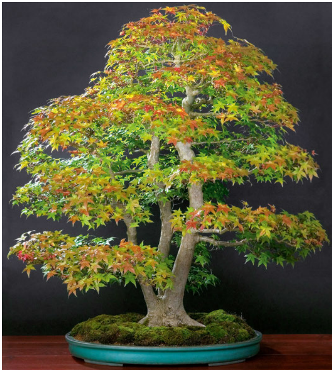
◀ Japanse esdoorn ( Acer palmatum ), driestam, ca. 80 jaar oud, hoogte ca. 90 centimeter. De vorm, structuur en het karakter van de boom rijpen met het toenemen van de leeftijd.

groot – maakt het mogelijk een boom die anders in de natuur alleen vol ontzag vanaf een afstand kan worden bekeken, van heel dichtbij te bestuderen. Veel mensen hebben namelijk een bijzondere band met een bepaalde boomsoort. Als ze de kans krijgen deze boom te verzorgen als bonsai, leren ze de behoeftes, reacties en het levensritme ervan heel intensief kennen. Met een eik of beuk in miniatuurvorm kan men een gezamenlijke levensweg volgen, die overigens ook niet hoeft te worden onderbroken als men gaat verhuizen.