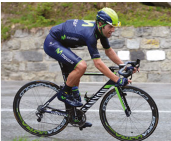
BOVEN Met een goede bikefitting voel je je één met je fiets.

Niet alleen een onhandige houding moet voorkomen worden. Uren achter elkaar fietsen vereist dat je je houding en je constant herhaalde trapbeweging voor langere tijd kunt volhouden. Voor de duidelijkheid: stel dat je de pedalen 90 keer per minuut in het rond trapt – het gemiddel-