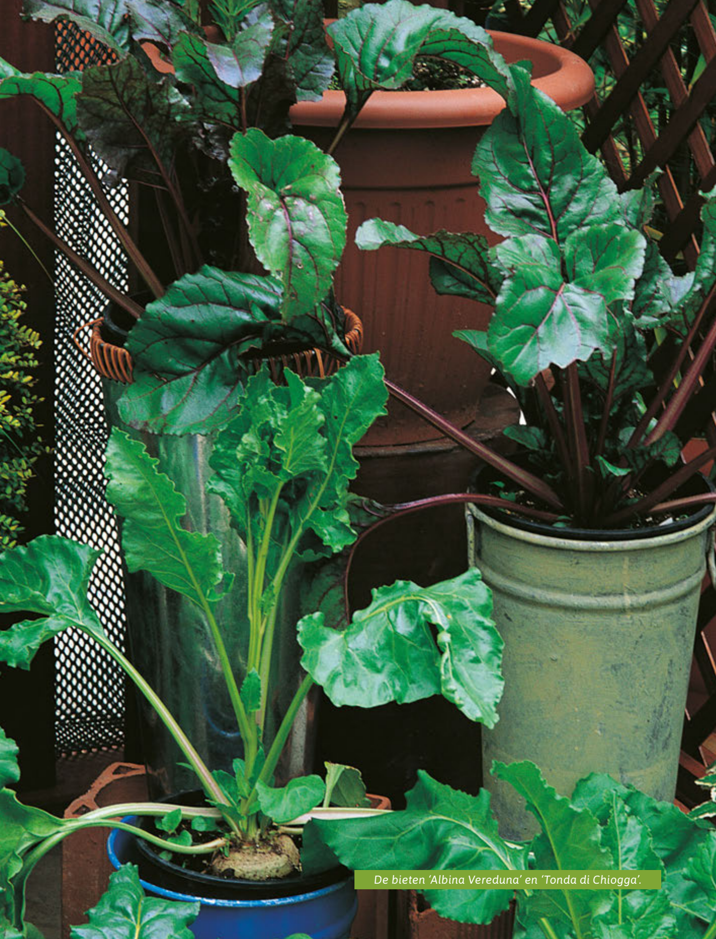
De bieten 'Albina Vereduna' en 'Tonda di Chioggia'.