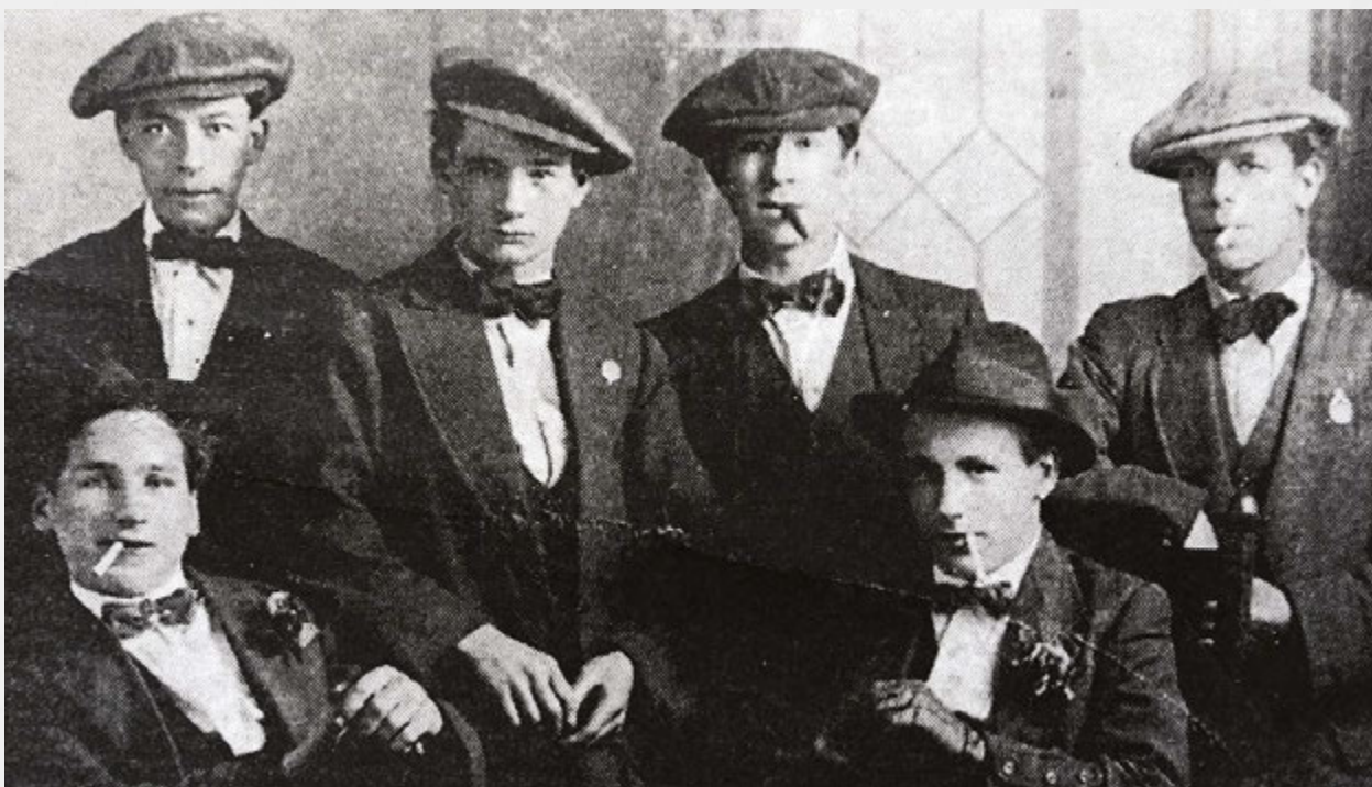
De echte Peaky Blinders, rond 1917

Inleiding door Steven Knight, bedenker en schrijver