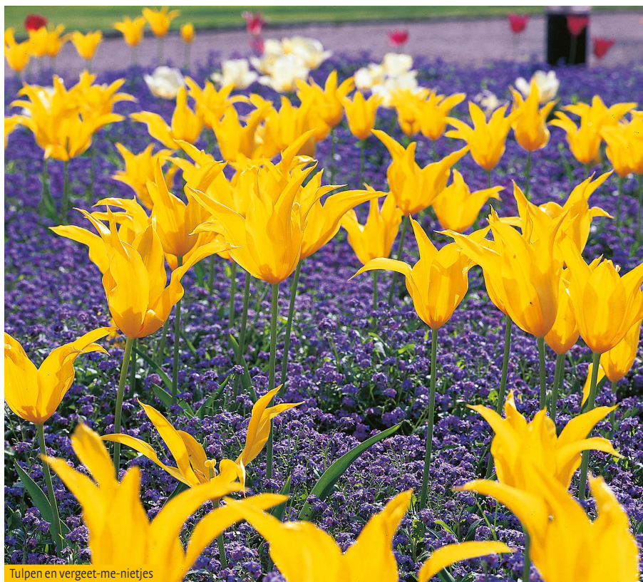
Tulpen en vergeet-me-nietjes