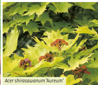
Acer shirasawanum 'Aureum'