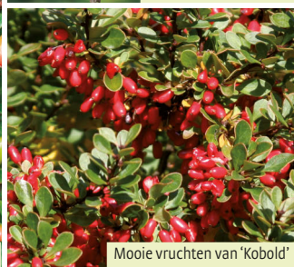
Mooie vruchten van 'Kobold'