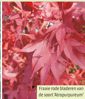
Fraaie rode bladeren van de soort 'Atropurpureum'