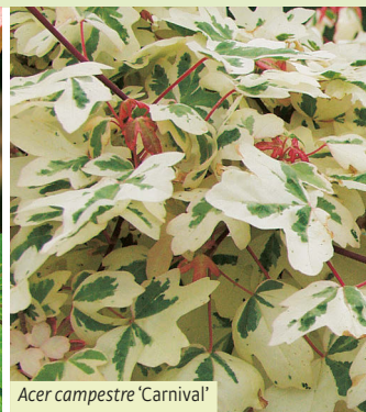
Acer campestre 'Carnival'