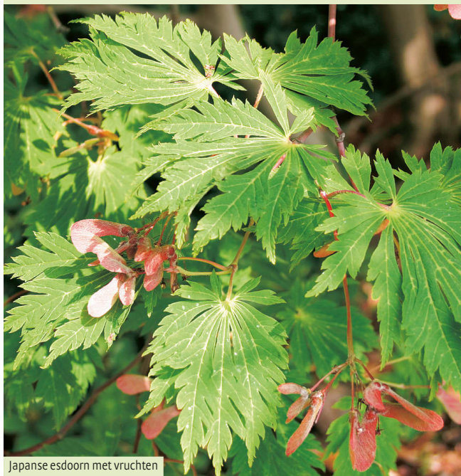
Japanse esdoorn met vruchten