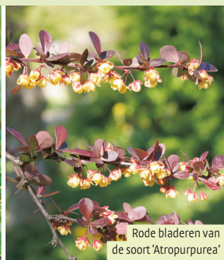
Rode bladeren van de soort 'Atropurpurea'