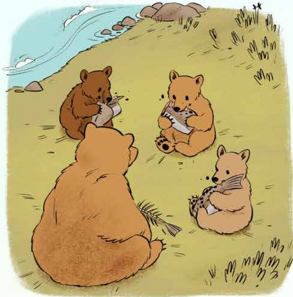
We waren nog maar kleine welpjes. Mama's lieve troetelberen.