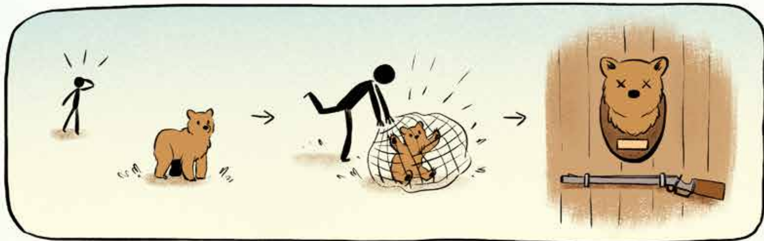
Ze leerde ons dat we moesten uitkijken voor gevaar. En vooral voor mensen!