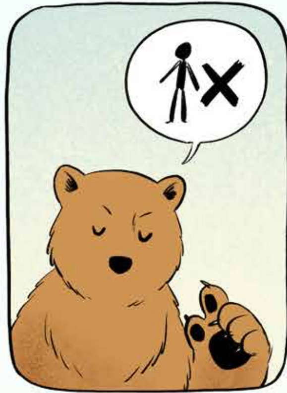
Mama deed altijd alles om ons te beschermen.