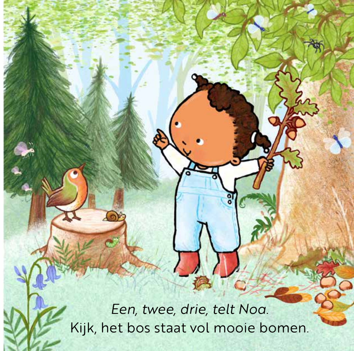
Een, twee, drie, telt Noa. Kijk, het bos staat vol mooie bomen.