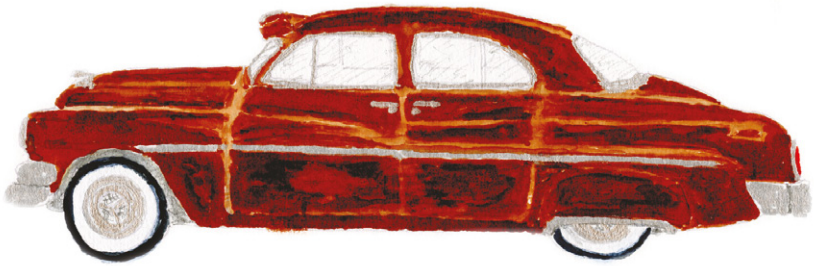
Monarch sedan uit 1951