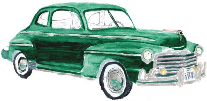
Monarch businesscoupé uit 1948