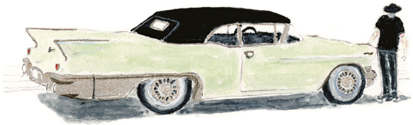
Eldorado Biarritz cabriolet