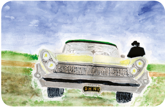
Lincoln Continental 'Lincvolt' uit 1959