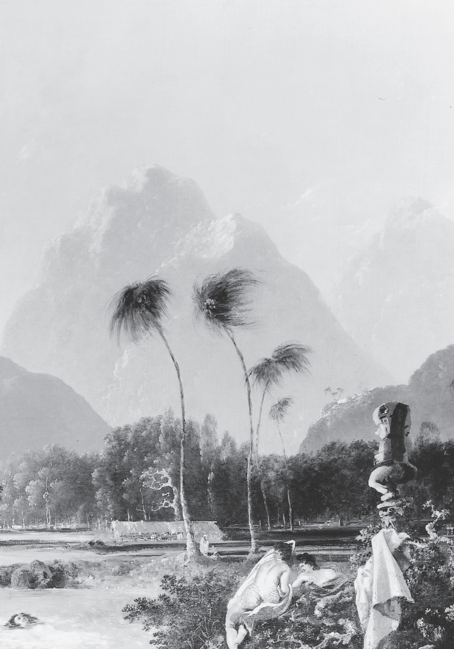
William Hodges, Tahiti Revisited , 1776