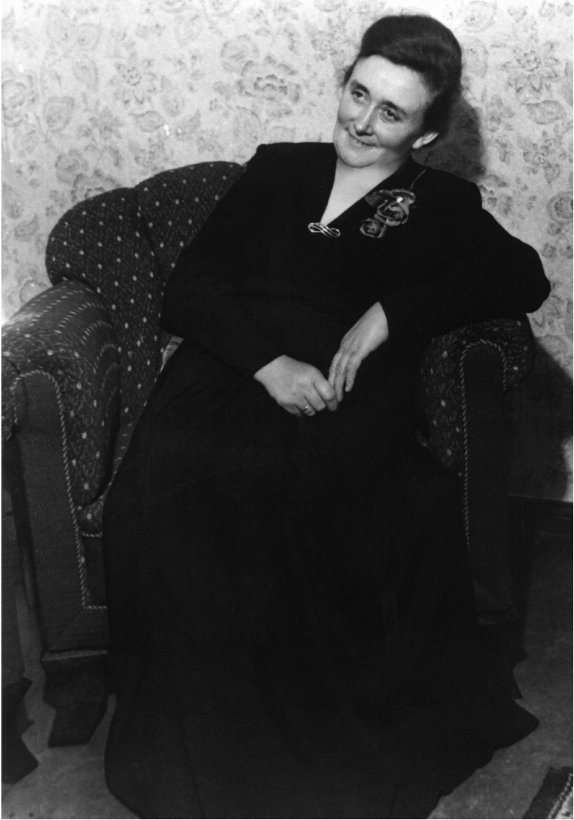
Oma, achter het IJzeren Gordijn.