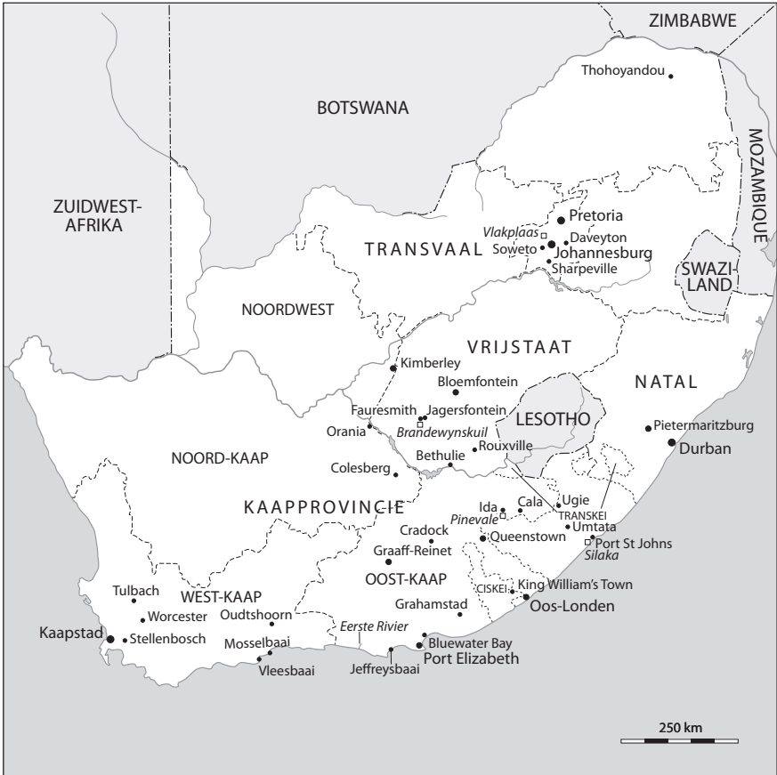
ZUID-AFRIKA TEN TIJDE VAN APARTHEID