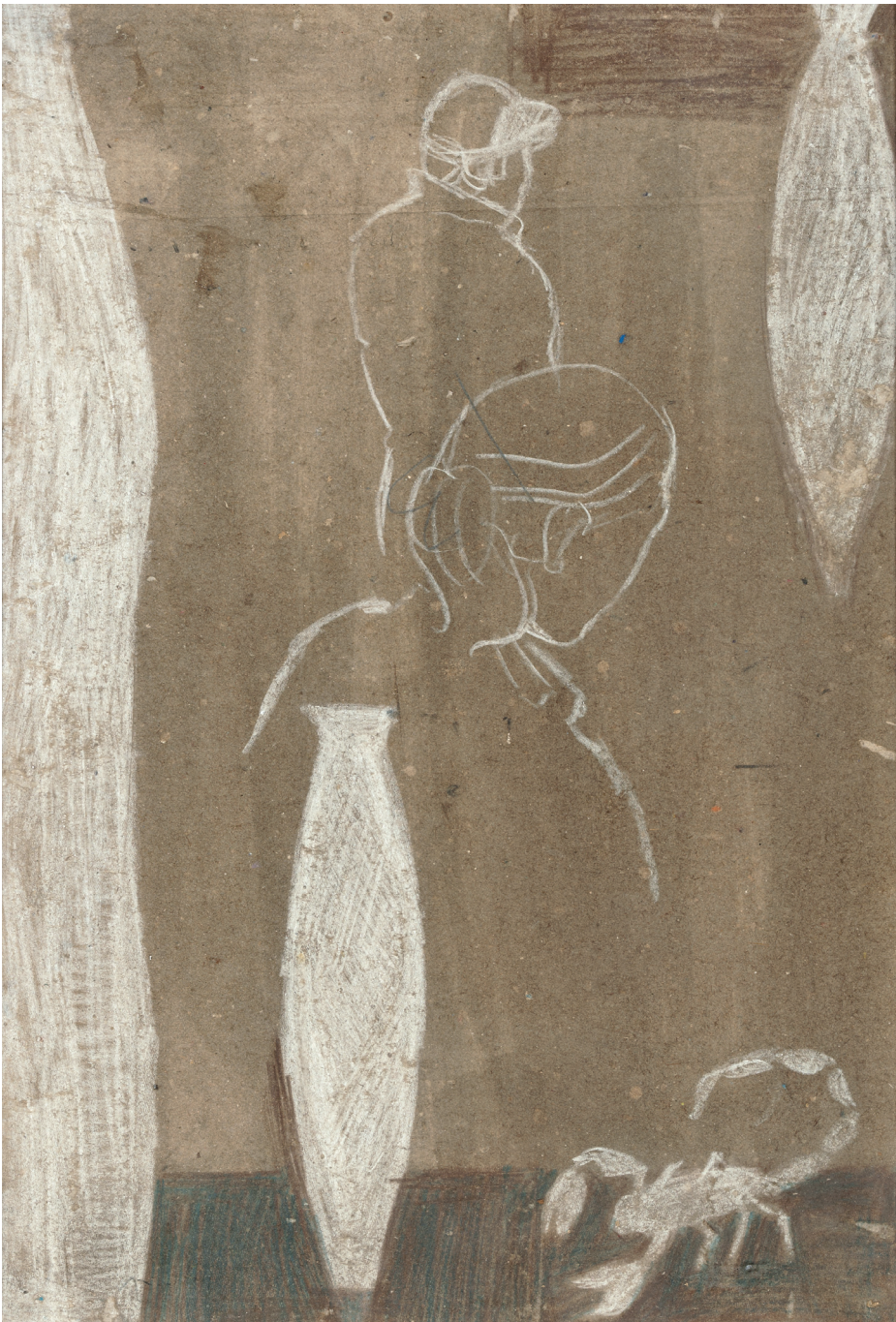
LKX DRAWING (detail) 2012