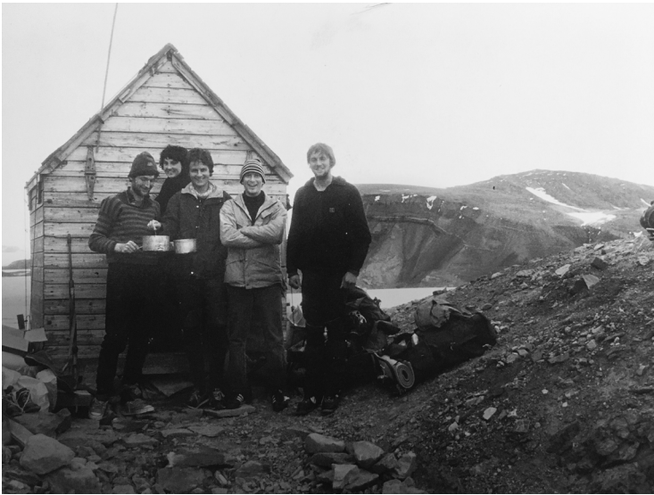
Hotel California, Ny-Ålesund, Spitsbergen, 1982.

Beste Dan Richards, Je reizen zullen niet eenvoudig zijn, maar het project waar je aan werkt is fascinerend. [...] Ik wens je het allerbeste, met name op Spitsbergen. Groet,