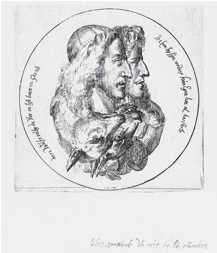
Voorbeeld van een zeventiende-eeuwse spotprent: de gebroeders De Witt blijken een wolf en een vos wanneer je hun portretten omdraait.

commentaar. De humor wil een bepaald punt maken, over de politieke actualiteit, de tijdgeest of de laatste mode. In de praktijk zijn dergelijke categoriseringen echter ook vaak simpelweg een kwestie van gewoonte en traditie. Zo vormt het label satire binnen de televisiewereld een veelgebruikte aanduiding, terwijl het binnen de context van het cabaret veel minder vaak voorkomt. Cabaret wordt dan weer wel heel direct aan humor