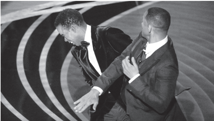
Still van de klap die Will Smith uitdeelt aan Chris Rock tijdens de Oscaruitreiking op 27 maart 2022.

Ook internationaal tieren de humorschandalen de laatste jaren welig. Enkele recente voorbeelden zijn het protest van een aantal medewerkers van Netflix in de Verenigde Staten naar aanleiding van een comedyspecial van de populaire Amerikaanse comedian Dave Chappelle 10 en de klap die acteur Will Smith uitdeelde aan comedian Chris Rock tijdens de Oscaruit-